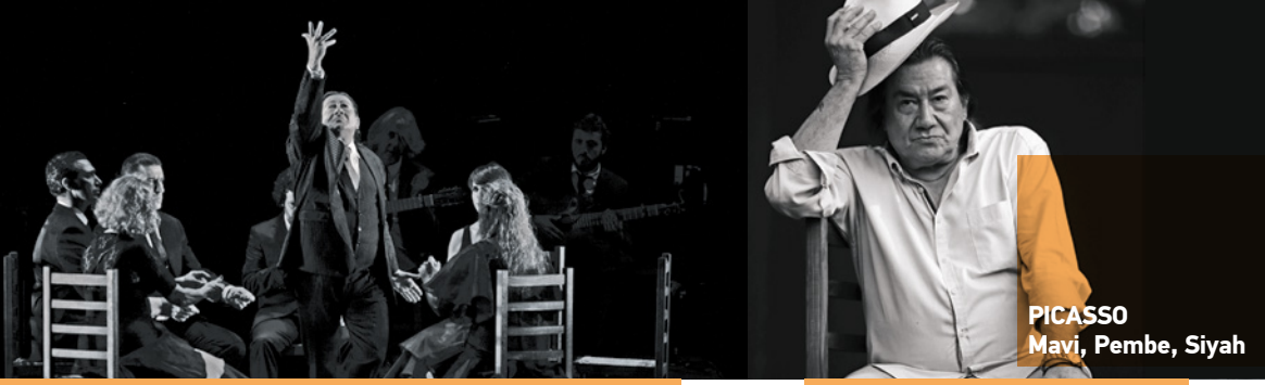
PICASSO Mavi, Pembe, Siyah