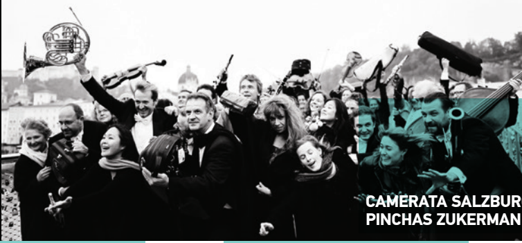
CAMERATA SALZBURG PINCHAS ZUKERMAN yöneten/keman

L. van Beethoven: Romance No.1 Sol Major Op.40